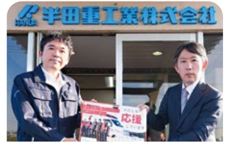
半田重工業株式会社 様