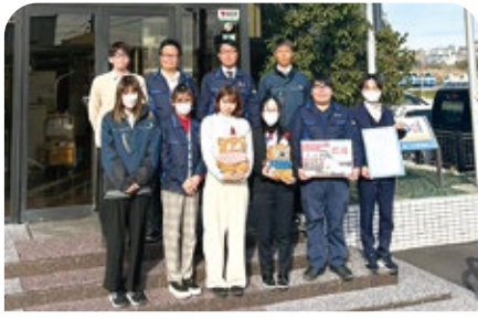
トーエイ株式会社 様