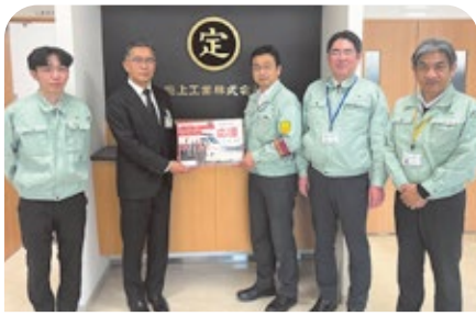
瀧上工業株式会社 様