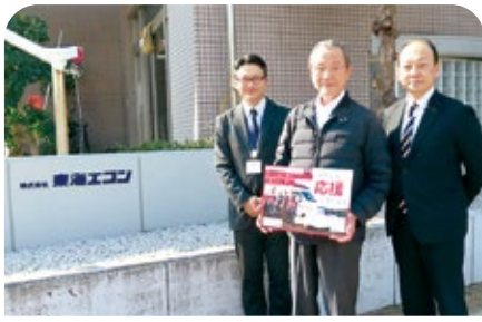
株式会社東海エコン 様