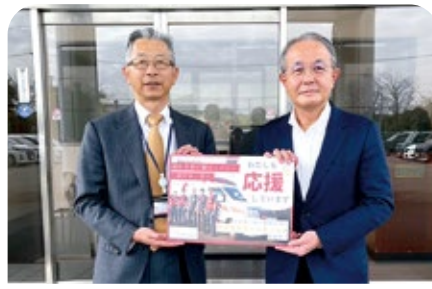
久野金属工業株式会社 様