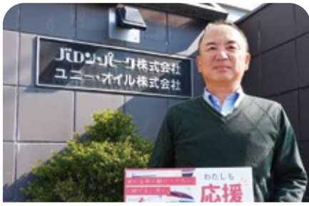
ユニオイル株式会社 様