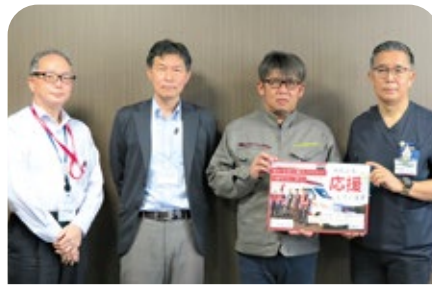
マルヨシ電機株式会社 様