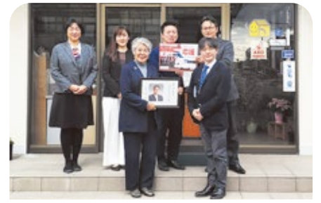
株式会社マルタケ 様