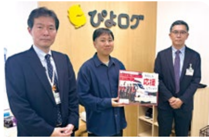
株式会社びよログ 様