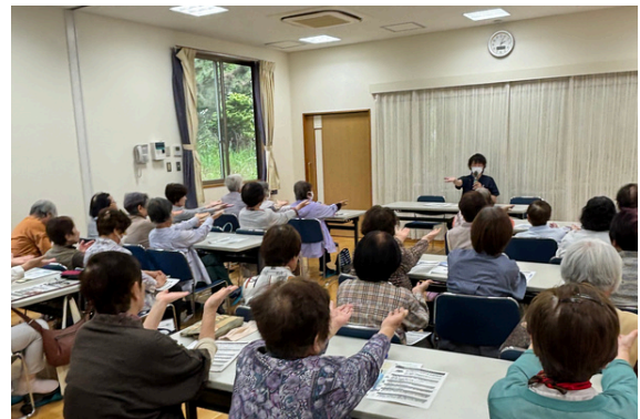
過去の出前講座の様子

夏は、気温の上昇とともに足のむくみや皮膚トラブルが起こりやすくなる時期でもあります。「自分の足を見ること、触ること、気にかけること」。フットケアについて、糖尿病の有無に限らず、高齢の方全てに関わる内容を詳しく解説します。